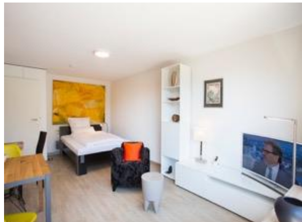
Wohnen / Schlafen