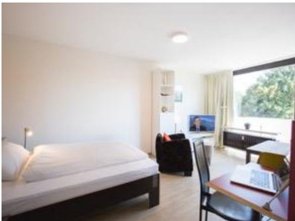
Wohnen / Schlafen