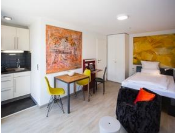
Wohnen / Schlafen