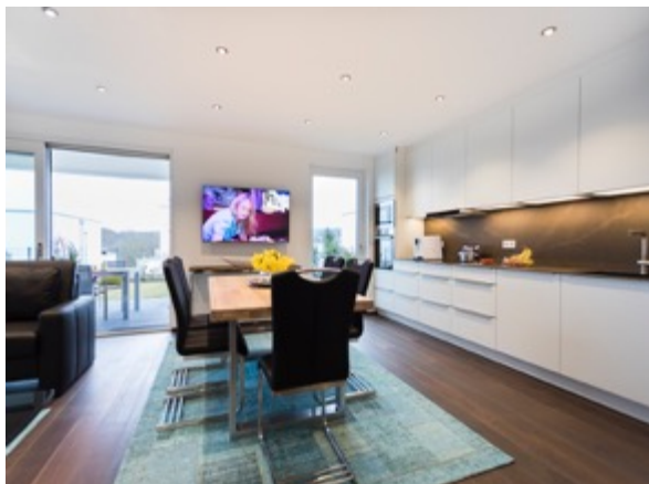
Essen / Kochen