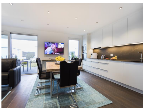
Essen / Kochen