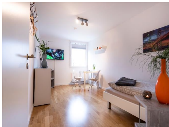
Wohnen / Schlafen