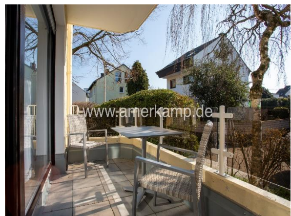
Balkon (Zugang Wohnzimmer)