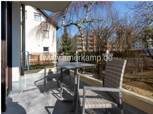
Balkon (Zugang Schlafzimmer)