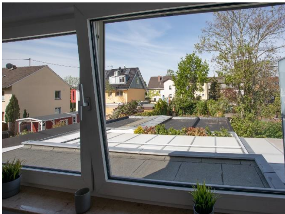
Wohnen - Ausblick